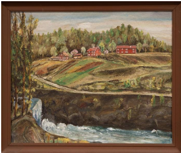
Oljemaleri på lerret med motiv fra Hammerbakken og Kniphammerdammen. Kunstner ukjent. Malt i 1945.